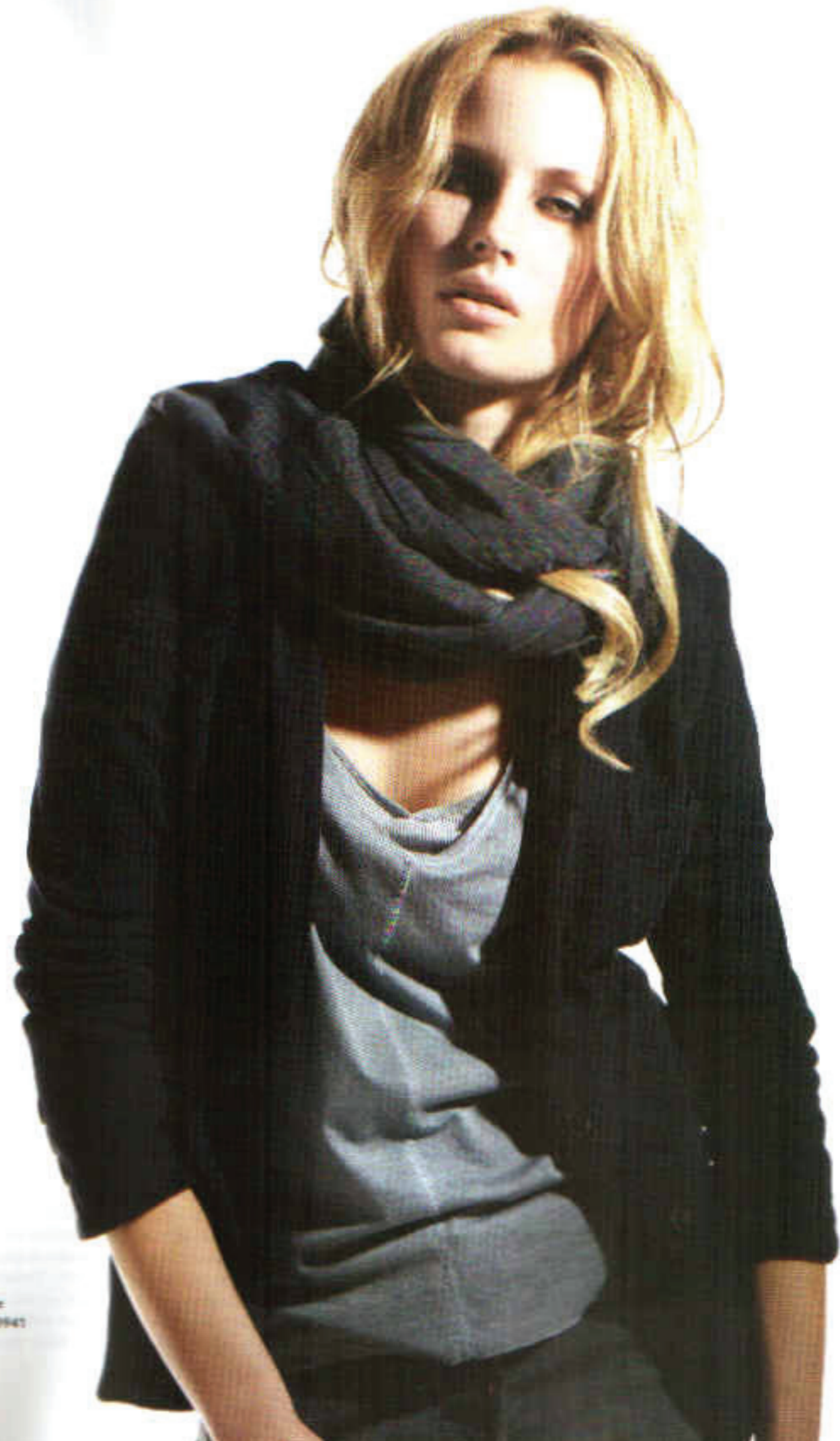
Blauer Vertigo Shirt & Hose 0941 Schuh Frau